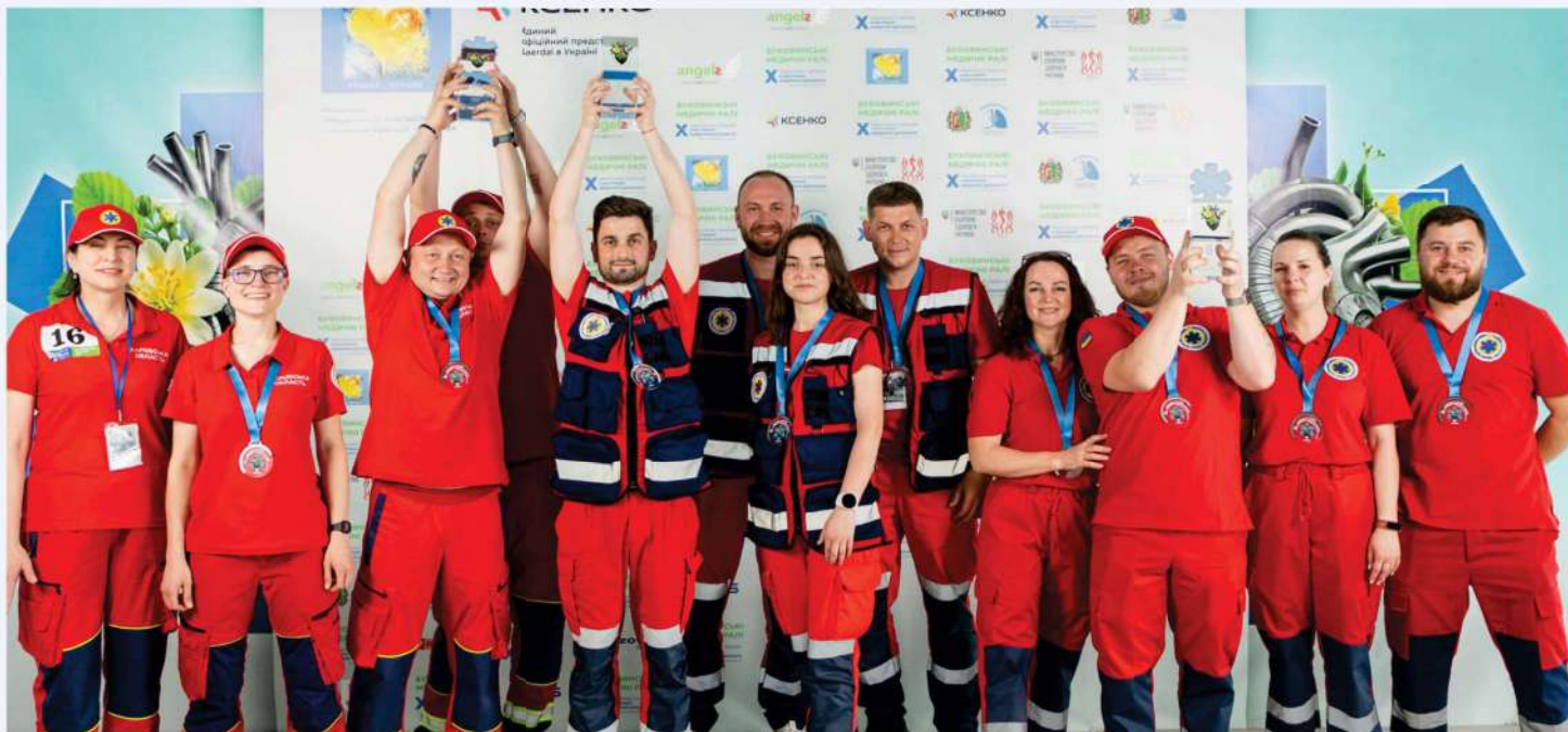
Les équipes gagnantes, avec de gauche à droite : Kharkiv, Volhynie, Tcherkassy