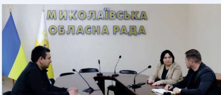
Réunion de coordination sur l'aide à la région de Mykolaïv