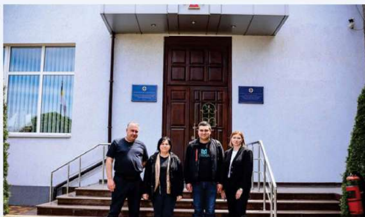
DSNS de Mykolaïv