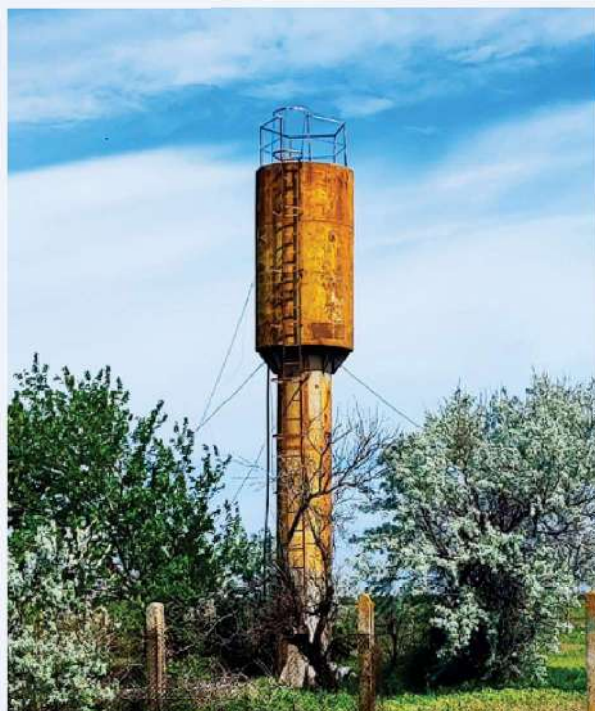
Château d'eau de Kozyrka