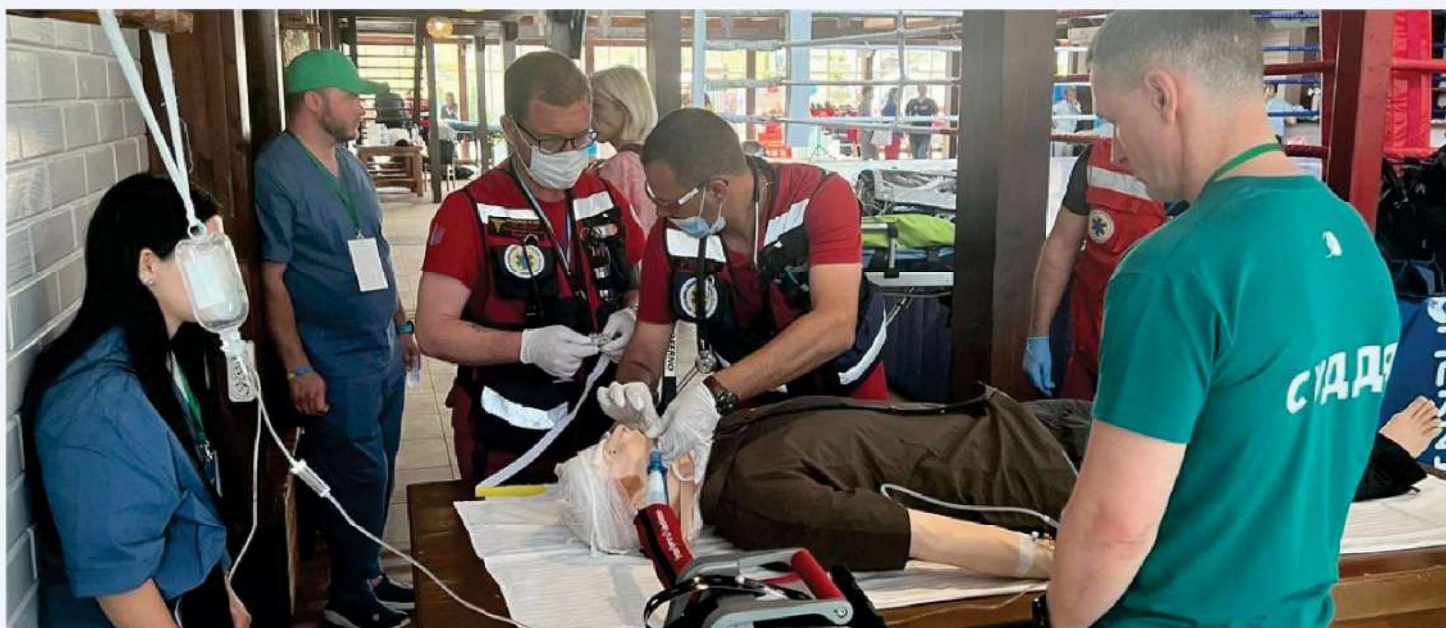
Mannequin SimMan pendant les épreuves du championnat

Nous avons réaffirmé notre soutien aux équipes médicales avec la poursuite des formations et l'aide en ambulances, médicaments, équipements et consommables médicaux.