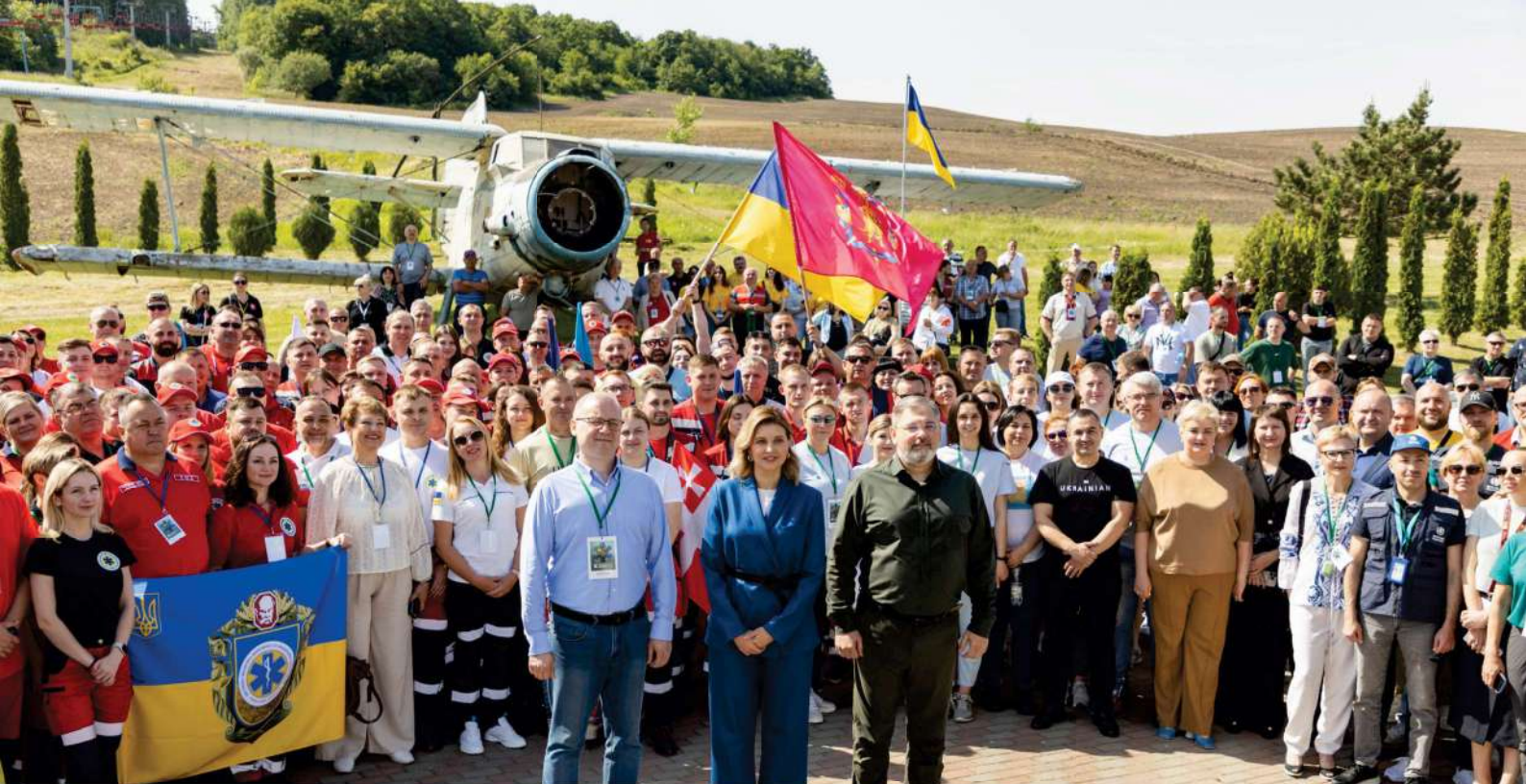
L'ouverture du championnat par Olena Zelenska