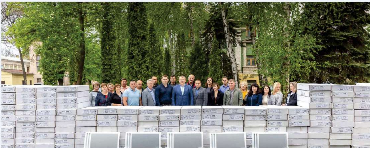
Distribution de panneaux rayonnants aux municipalités proches de la ligne de front

Nous continuons notre soutien à cette région en livrant des véhicules sanitaires, des médicaments, des équipements médicaux et en installant des systèmes de filtration d'eau potable dans les zones sinistrées suite à l'explosion du barrage de Kakhovka.