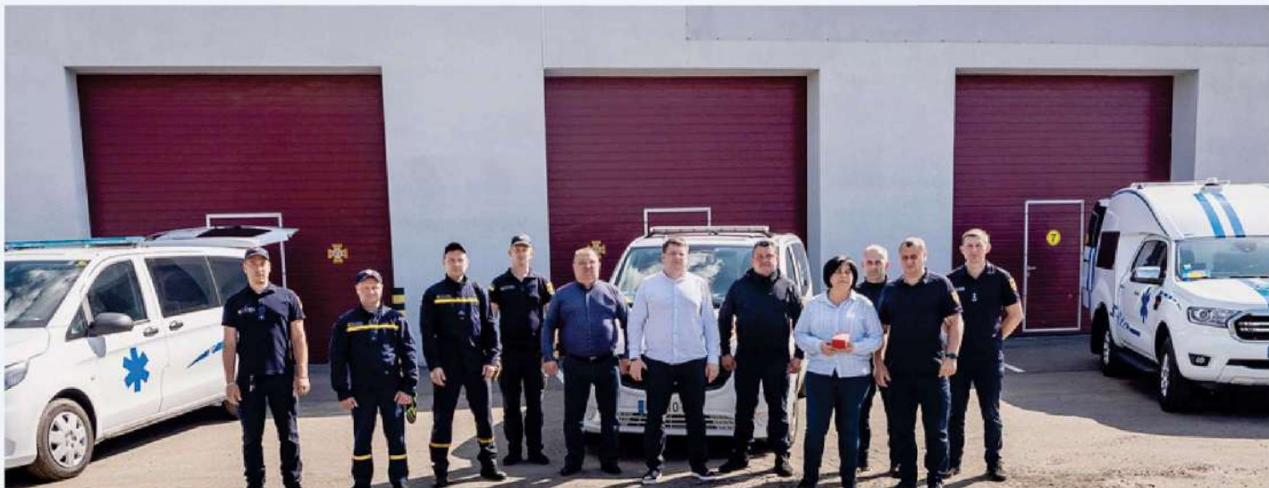
Transmission de 3 ambulances

Lors de cette mission, 3 ambulances ont été transmises au Service des situations d'urgence de la région de Dnipro. Nous avons pu discuter avec le Conseil régional des problèmes actuels de la région et de l'aide déjà apportée dans le cadre de notre coopération.