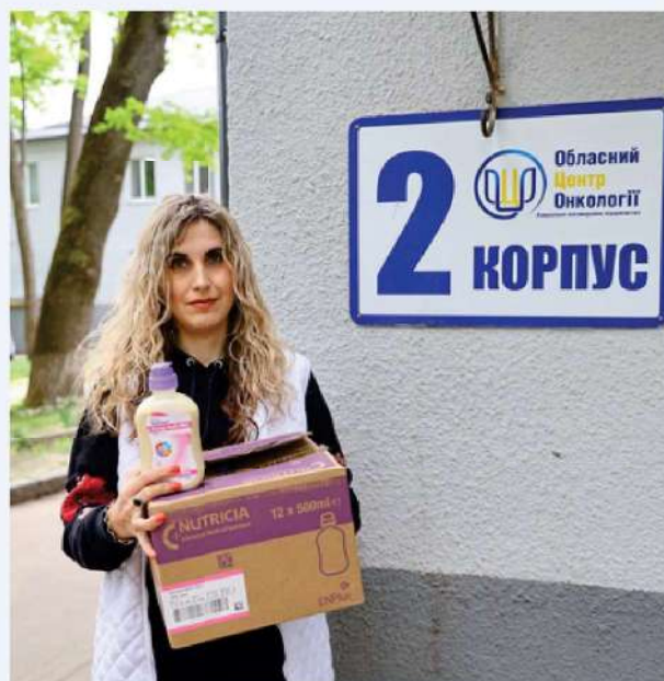
Nourriture entérale. Hôpital de Kharkiv