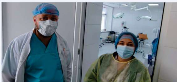
Visite de l'hôpital régional de Mykolaïv