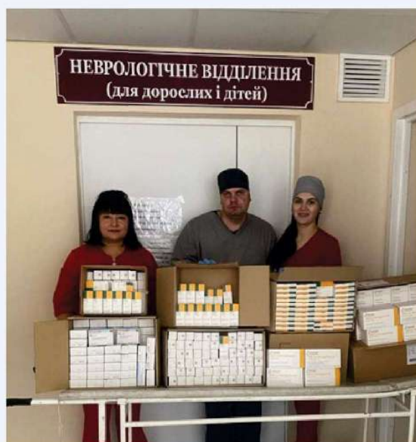
Distribution de médicaments, hôpital de Soumy