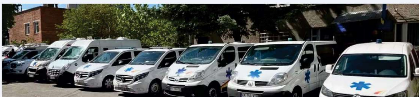
L'arrivée du convoi à Lviv (Ukraine)

Une ambulance 4x4 Ford Ranger a été achetée grâce à une subvention de la fondation Alstom pour l'unité de travaux pyrotechniques et de déminage humanitaire de la région de Dnipro. 3 autres ambulances ont été transmises grâce à l'association Anjou-Lviv - Les Joyeux Petits Souliers, dont 2 pour Kharkiv et une pour l'hôpital de Tourka (région de Lviv).