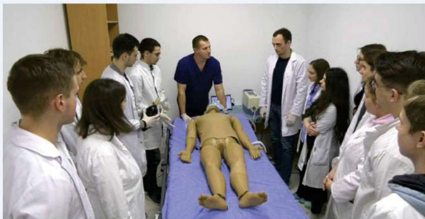
Premiers cours dans le nouveau centre de formation

La guerre en Ukraine pose d'énormes défis, notamment aux travailleurs du domaine de la santé en première ligne. En plus de fournir une assistance matérielle, nous soutenons les centres de formation médicale. Ces centres forment médecins, secouristes et populations aux soins d'urgence en temps de guerre.