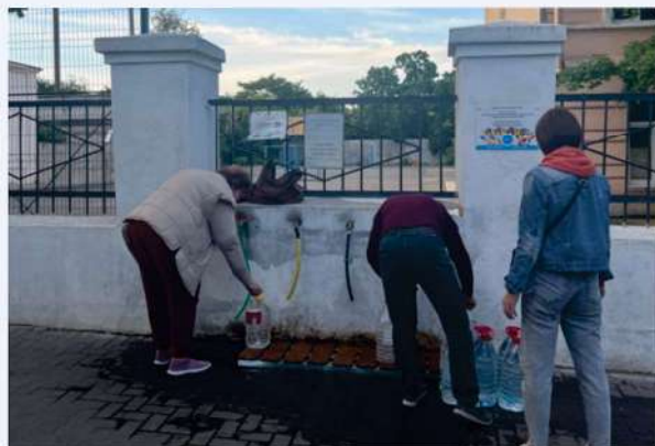
Point de distribution d'eau potable, appartenant à une ONG