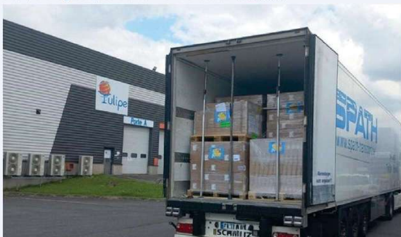
Un camion de médicaments de Tulipe

Ainsi que Rotary Club de Bordeaux-les-Jalles pour la prise en charge des frais logistiques du convoi Bordeaux-Kharkiv.