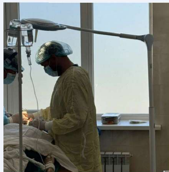
Lampe opératoire mobile PentaLED à Kharkiv

Nous remercions la région Bourgogne-Franche-Comté pour son aide.