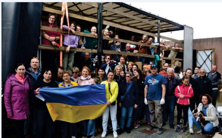
Chargement à Bordeaux

Nous poursuivons notre action de fourniture de produits essentiels aux structures médicales et sociales ainsi qu'à la population ukrainienne touchée par la guerre. En 3 mois, l'association a envoyé depuis la France une aide humanitaire de 1,73 M€.