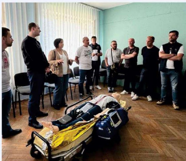
Visite de la délégation des ambulanciers français du centre de formation de la Médecine d'urgence de Lviv