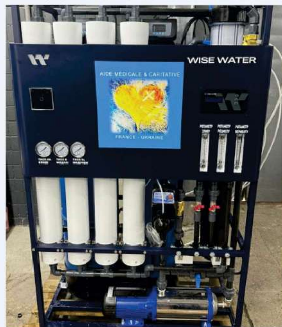
Station de filtration, prête à être livrée à Orikhiv

Les unités du DSNS présentes dans ces villes distribuent de l'eau technique à la population à partir de forages. Après des études menées conjointement avec le DSNS et les fournisseurs de matériel et une mission sur le terrain, deux stations modulaires d'osmose inverse avec préfiltration d'eau, d'une capacité de 1m 3 /h chacune, ont été commandées, avec des composants et éléments filtrants pour un an. Elles devraient fournir de l'eau potable avant l'arrivée de la chaleur estivale.