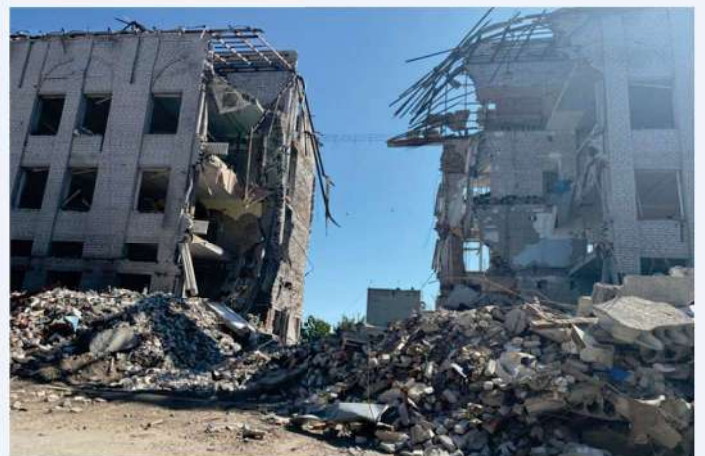
Immeubles détruits à Orikhiv

Notre association a fourni au DSNS d'Orikhiv une ambulance Toyota 4x4 pour les évacuations sanitaires et les secours lors des bombardements. Cette mission avait pour but de valider le projet d'installation de 2 systèmes de filtration afin que la population des villes d'Orikhiv et de Goulai Polié puisse avoir de l'eau potable sur place, sans dépendre de livraisons extérieures irrégulières.