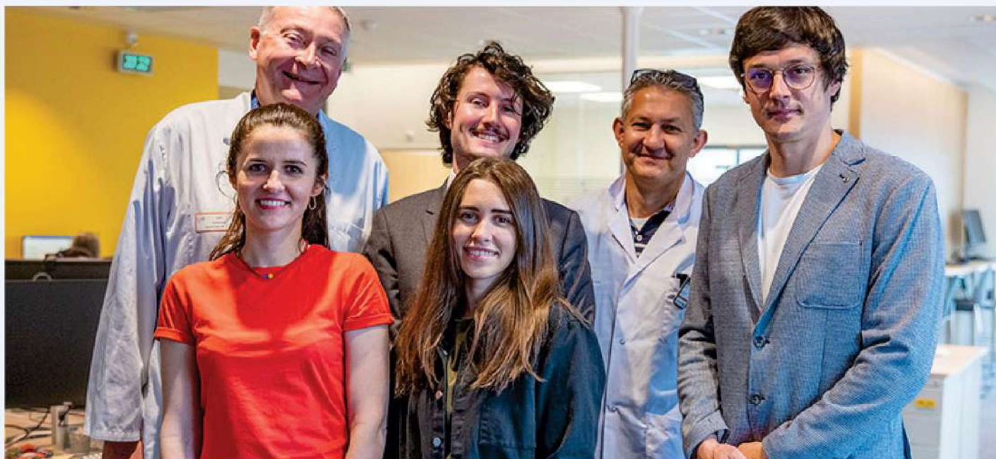
Accueil de deux stagiaires ukrainiennes au CHU de Poitiers

Du 19 mai au 5 juin 2024, deux médecins du Premier Groupement médical de Lviv ont été accueillis au CHU de Poitiers pour une formation en radiologie d'urgence.