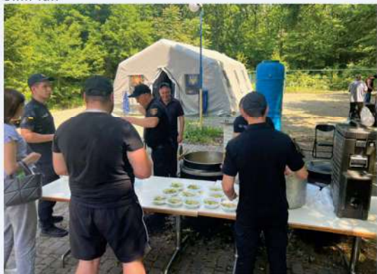
La cuisine de campagne de DSNS

En parallèle, les discussions avec nos partenaires - le Conseil de réanimation et de la médecine d'urgence, le Ministère de la Santé et le Centre scientifique et pratique ukrainien pour les soins médicaux d'urgence et la médecine de catastrophe - portaient sur la réforme de la Médecine d'urgence et la formation unifiée pour tous les centres régionaux.