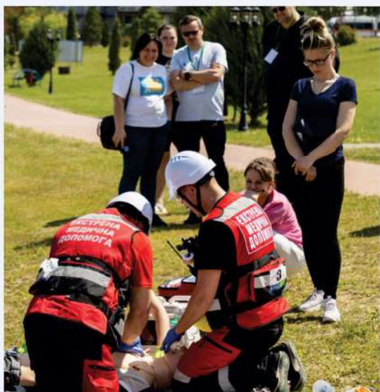
Les épreuves du championnat avec le mannequin SimMan

Les épreuves, soigneusement élaborées, et les mannequins interactifs fournis lors des simulations ont permis de recréer des situations de sauvetage très proches de la réalité, mettant en lumière certaines lacunes dans la formation.