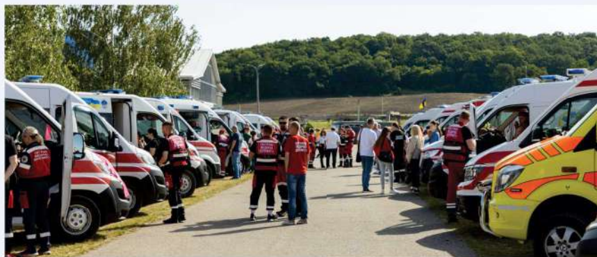
Les équipes de Médecine d'urgence se préparent pour le début des épreuves

En parallèle, les discussions avec nos partenaires - le Conseil de réanimation et de la médecine d'urgence, le Ministère de la Santé et le Centre scientifique et pratique ukrainien pour les soins médicaux d'urgence et la médecine de catastrophe - portaient sur la réforme de la Médecine d'urgence et la formation unifiée pour tous les centres régionaux.