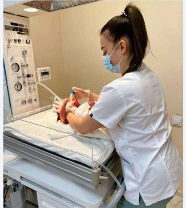
Table de réanimation néonatale, fournie à la maternité de Zaporijjia

Grâce au financement de la région d'Île-de-France, nous avons pu fournir aux hôpitaux et maternités de Zaporijjia du matériel périnatal et chirurgical. Les livraisons de médicaments et de consommables médicaux se font également directement aux hôpitaux. Il manque cependant une coordination régionale pour simplifier la logistique et assurer le lien avec un réseau plus large d'hôpitaux. L'administration régionale s'est montrée intéressée par un partenariat, promettant la mise à disposition d'un dépôt humanitaire à Zaporijjia et l'implication des coordinateurs de l'administration et du département de santé.